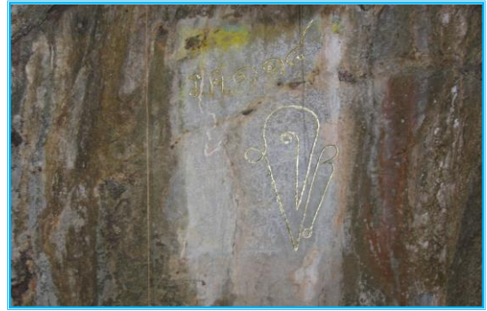
พระปรมาภิไธย ย่อ จปร. ปี ร.ศ.๑๑๘ (อยู่บริเวณ